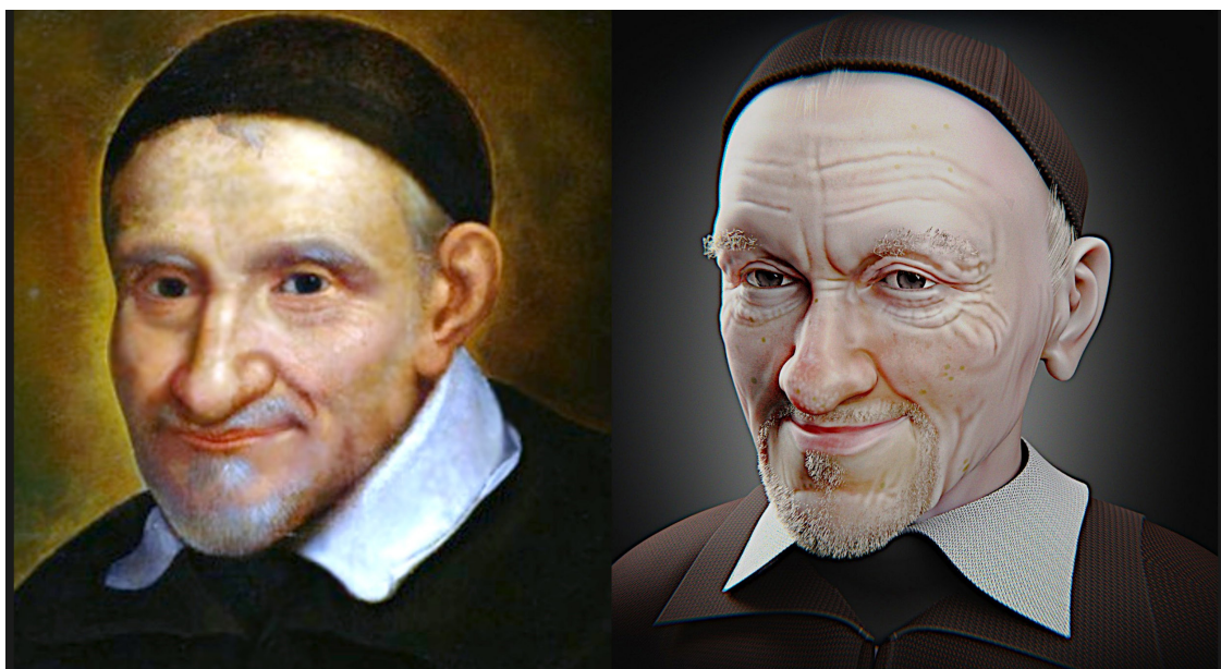
Comparação entre a icografia clássica e a imagem resultante da aproximação facial